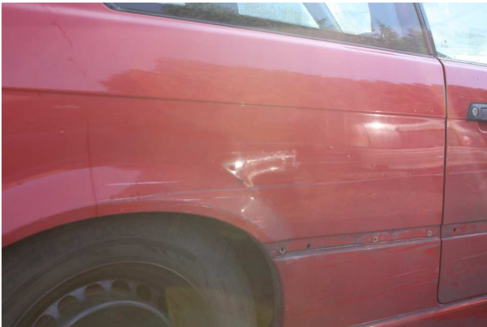
Bild 14: Lack- und Karoserieschäden an dem hinteren rechten Seitenteil