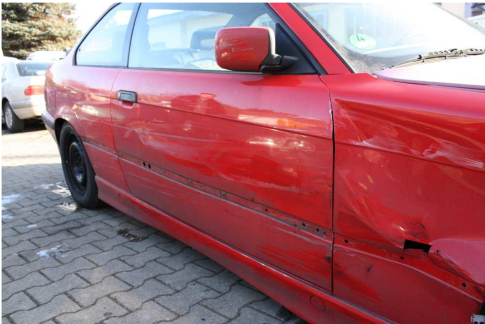
Bild 8: Beschädigungen an der rechten Tür und dem vorderen Kotflügel